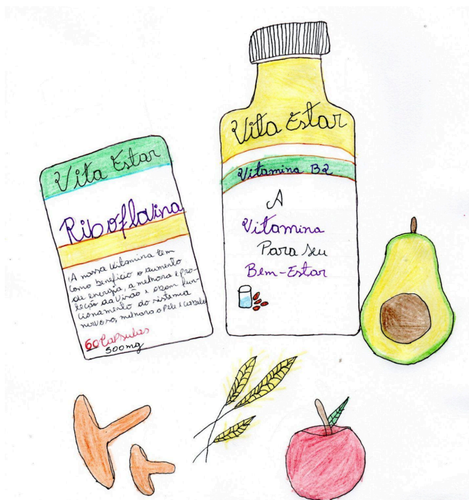
Figura 2: Resultado da produção do rótulo da vitamina B2 feita pelos alunos.