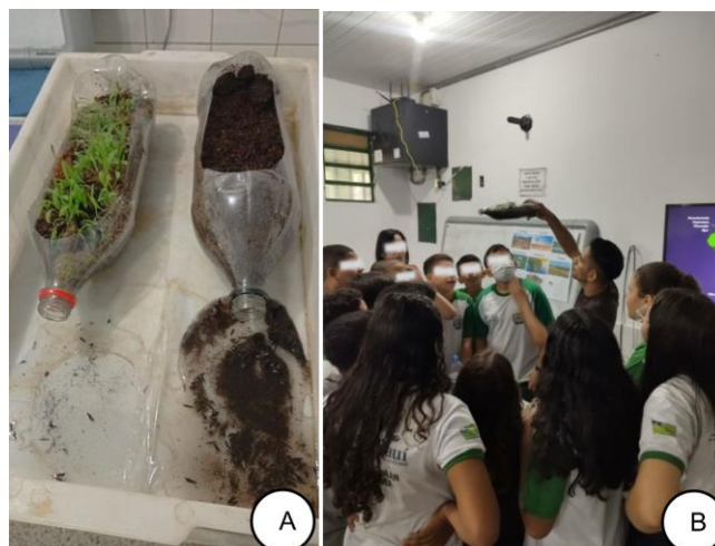
Figura 4: Experimento de erosão. A: resultado da simulação; B: Explicação dos resultados.

O modelo se comporta como um experimento ao simular os efeitos da precipitação sobre solos degradados e não degradados, relacionando esse processo à proteção dos cursos d'água e da vegetação (Souza, 2017). A estrutura do experimento consiste em duas garrafas PET preenchidas com substrato. Na primeira garrafa (à esquerda da Fig. 4A), foram plantadas sementes de alpiste, que germinaram juntamente com musgos. Já na segunda garrafa (à direita da Fig. 4A), foi utilizado apenas o substrato, sem vegetação. A demonstração da experimentação (Fig. 4B) ocorreu com a participação ativa dos alunos, enquanto os fenômenos eram explicados conforme se desenrolavam, incluindo a precipitação, o acúmulo de água no sistema e, por fim, o processo de erosão.