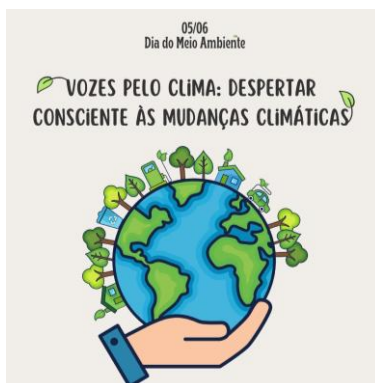
Figura 1: Identidade visual da ação