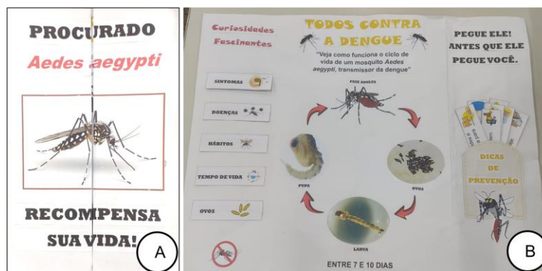
Figura 3: Lapbook informativo. A: capa; B: conteúdo.

ele! Antes que ele pegue você”, foram adicionados cards com dicas de prevenção, alertando sobre medidas como evitar o acúmulo de água parada.