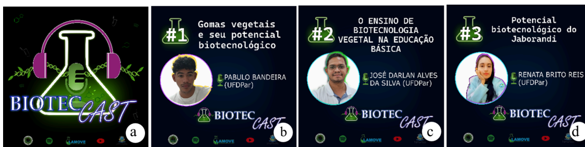
Figura 3. Capas de episódios postadas. Logo oficial do Biotec Cast; b-d. episódio 1- Gomas vegetais e seu potencial biotecnológico; Episódio 2 - O ensino de biotecnologia vegetal na educação básica; e episódio 3. Potencial biotecnológico do Jaborandi.

A divulgação dos podcasts tem um impacto semelhante ao dos reels , podendo alcançar milhares de visualizações de seguidores e não seguidores, sendo uma alternativa diferenciada do tradicional “Card ou Vídeo” para a divulgação das informações, além de promover a participação de mais indivíduos em sua produção. Quando gravados de maneira informal, podem criar laços de humanização, atraindo mais o público, além disso, em momentos de ensino e aprendizado, a elaboração de podcasts podem ser produzidos por alunos de diversos níveis de ensino, garantindo imersão nos assuntos e a participação efetiva dos educandos no processo de ensino e aprendizagem (Carvalho et al. , 2008). A Fig. 3 mostra a logo e as capas de cada episódio, as mesmas que foram postadas para a divulgação.