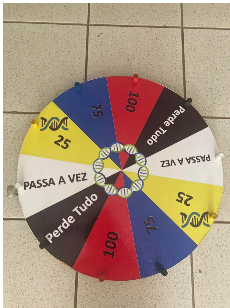
Figura 1: Roda Giratória do Jogo “Roda a Roda da Genética”, aplicado no curso de Licenciatura em Ciências Biológicas, da Universidade Federal do Piauí, Campus Amílcar Ferreira Sobral-CAFS/UFPI. Floriano – PI, Brasil, 2024.

Posteriormente, foi aplicada atividade lúdica “Roda a Roda da Genética”, desenvolvida por (SILVA; SILVA, 2021). O jogo consiste em uma roda giratória na qual as cores indicavam diferentes valores: vermelho (100 pontos), azul (75 pontos), amarelo (25 pontos), branco (passa a vez) e preto (perde tudo) (Fig.1). Para dar início ao jogo, a turma foi dividida em dois grupos, cada um com um representante.