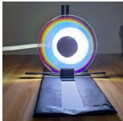
Figura 4: Modelo didático do túnel psicodélico com visualização do espectro de luz visível.

Para demonstrar aos alunos as ondas eletromagnéticas perceptíveis pelo olho humano, que compõem o espectro de luz visível, o professor pode utilizar o túnel psicodélico (Figura 4). Ao direcionar o feixe de luz de uma lanterna para o CD presente na estrutura, ocorrerá a dispersão da luz em diferentes comprimentos de onda, permitindo uma visualização prática e dinâmica do espectro visível.