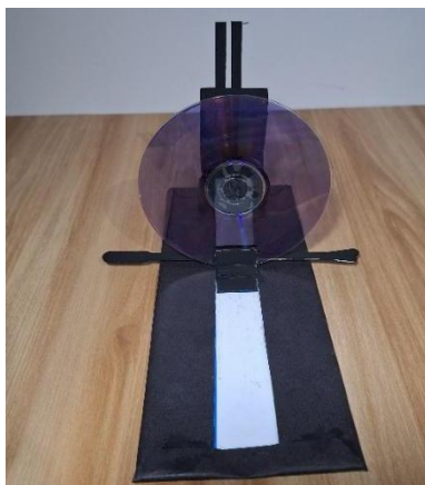
Figura 2: Modelo didático do túnel psicodélico.