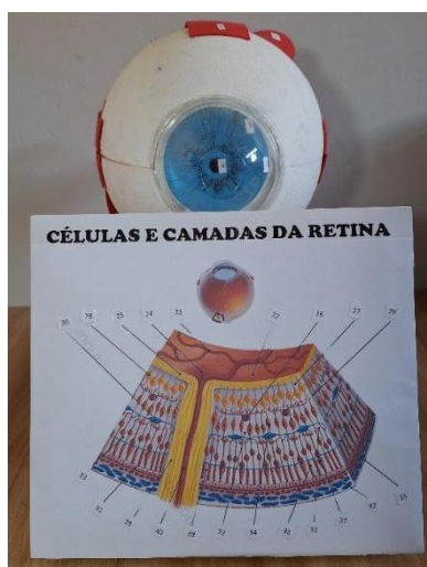
Figura 3: Células e camadas da retina.

Após apresentar a estrutura geral do olho, o professor pode aprofundar a explicação ao utilizar uma seção removível da maquete anatômica, que ilustra de forma ampliada as células e camadas da retina (Figura 3). A retina é uma camada complexa composta por várias células, incluindo bastonetes, cones, células horizontais, bipolares, amácrinas e ganglionares (Curi & Procópio, 2017).