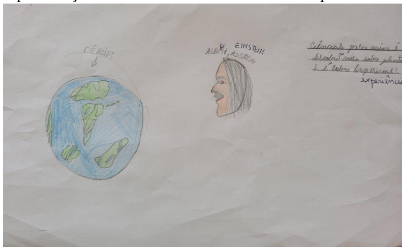
Figura 1: Representação de Albert Einstein como um exemplo de cientista branco.

diariamente, durante longos anos, considerável influência sobre um vasto número de pessoas” (ROSA; SILVA, 2015, p. 94).