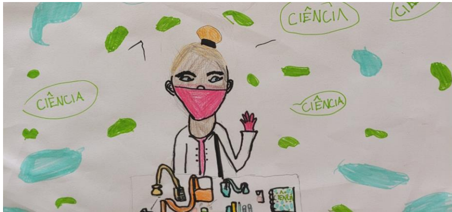
Figura 3: Representações de mulheres negras cientistas feitas por duas alunas do 6º ano do EF2.