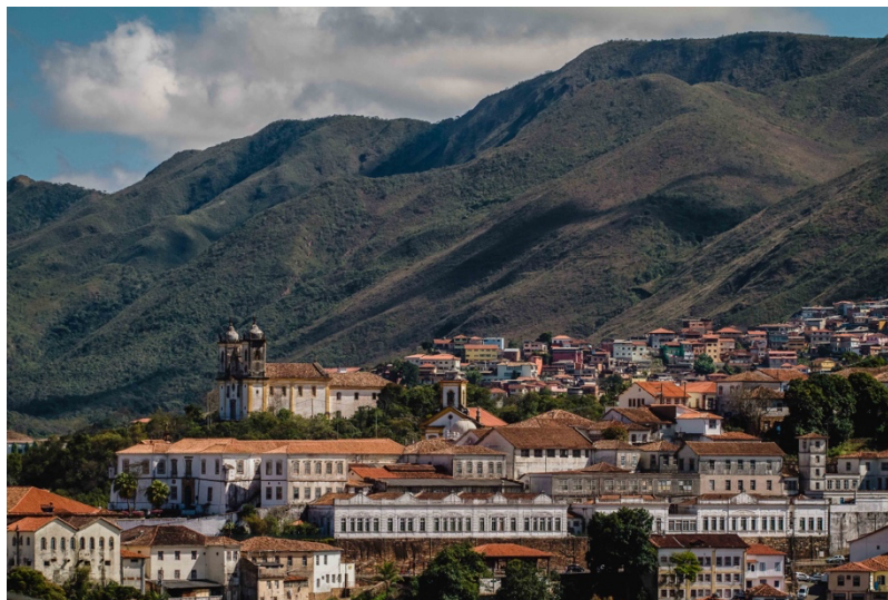
Figura 1: Vista parcial do centro histórico de Ouro Preto e, ao fundo, a Serra do Veloso