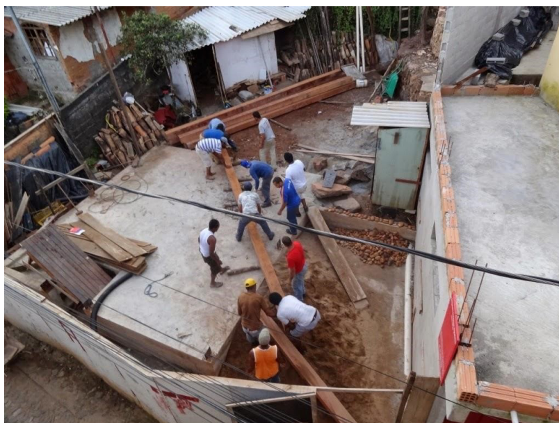
Figuras 4 e 5: Etapas de construção da edificação onde está localizada a atual Mina Du Veloso, nota-se na fig. 5 as técnicas construtivas de pau a pique.