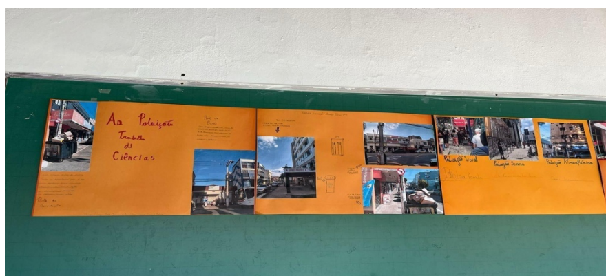
Figura 3: Cartazes produzidos

potente para que eles(as) compreendam a necessidade de se conectar temáticas e se tornar um sujeito crítico e atuante.