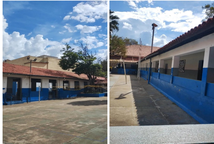
Figura 1. Escola