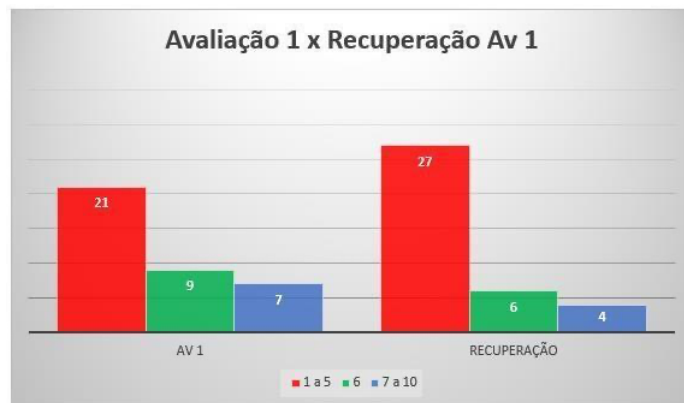
Gráfico 1: Dados comparativos da primeira parcial e a recuperação paralela referente a turma de 6 o V1

Ao analisarmos os dados referentes à primeira avaliação e à recuperação nas turmas 6 o v1 (Gráf. 1), 6 o v2 (Gráf. 2), 6 o v3 (Gráf. 3) e 6 o v4 (Gráf. 4), observamos um retrocesso em todas elas. Uma observação importante é que a recuperação é uma ferramenta de avaliação aberta a todos que desejam participar, mesmo aqueles que obtiveram aprovação na avaliação inicial. Como pode ser observado nas tabelas, mesmo os alunos que tinham alcançado notas mais altas na avaliação 1, não estavam preparados para a recuperação. Isso levanta questões sobre a eficácia da preparação dos alunos, independentemente do desempenho inicial.