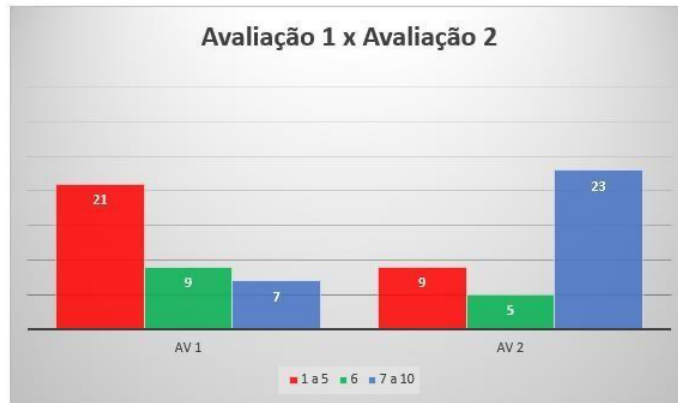
Gráfico 5: Dados comparativos da primeira parcial e da segunda parcial referente à turma .