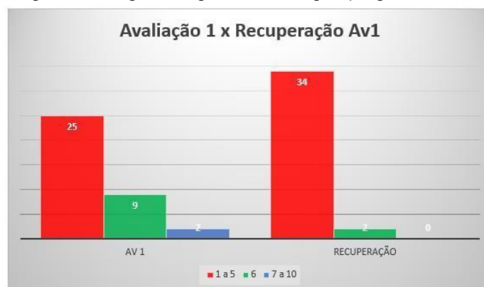
Gráfico 2: Dados comparativos da primeira parcial e a recuperação paralela referente a turma 6 o v2