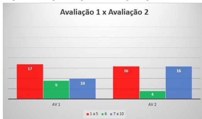
Gráfico 8: Dados comparativos da primeira parcial e da segunda parcial referente a turma de 6º V 3.