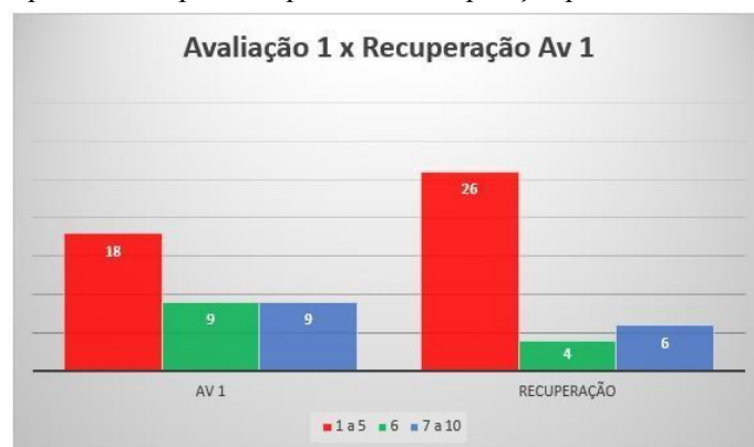
Gráfico 4: Dados comparativos da primeira parcial e a recuperação paralela referente a turma de 6º V4