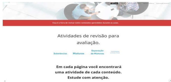
Imagem 1: Blog educativo com exercícios de revisão aplicado em todas as turmas do 6º ano.

com a utilização de tecnologias digitais, seguidas por atividades do livro didático também fez parte do segundo momento. Para auxiliar os estudantes em casa, um blog (Im. 1) foi desenvolvido com o objetivo de ajudá-los a se prepararem para a atividade avaliativa comparativa. Cada estudante recebeu um lembrete e o link de acesso foi compartilhado nas redes de comunicação da escola, enfatizando aos pais e aos estudantes a importância de estudar em casa. As dúvidas decorrentes do desenvolvimento das atividades foram esclarecidas em sala de aula.