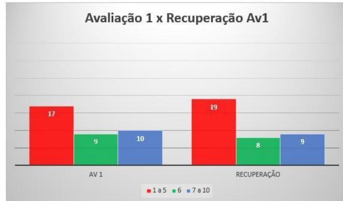
Gráfico 3: Dados comparativos da primeira parcial e a recuperação paralela referente a turma de 6º V3