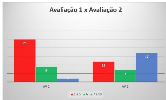
Gráfico 6: Dados comparativos da primeira parcial e da segunda parcial referente a turma de 6º V 2.