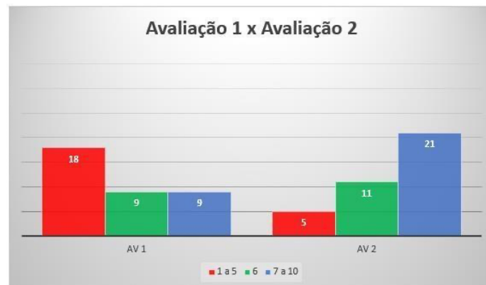
Gráfico 7: Dados comparativo da primeira parcial e da segunda parcial referente a turma de 6º V 4.