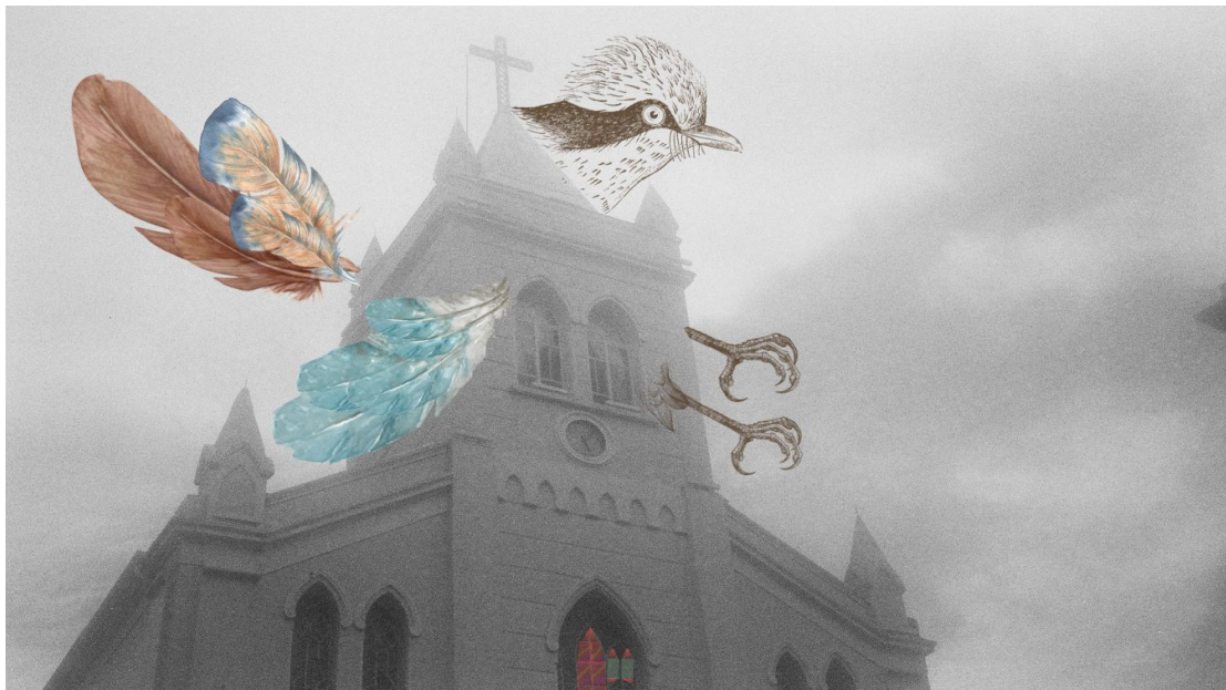
Figura 3. A arquitetura ornitológica de espécies urbanas