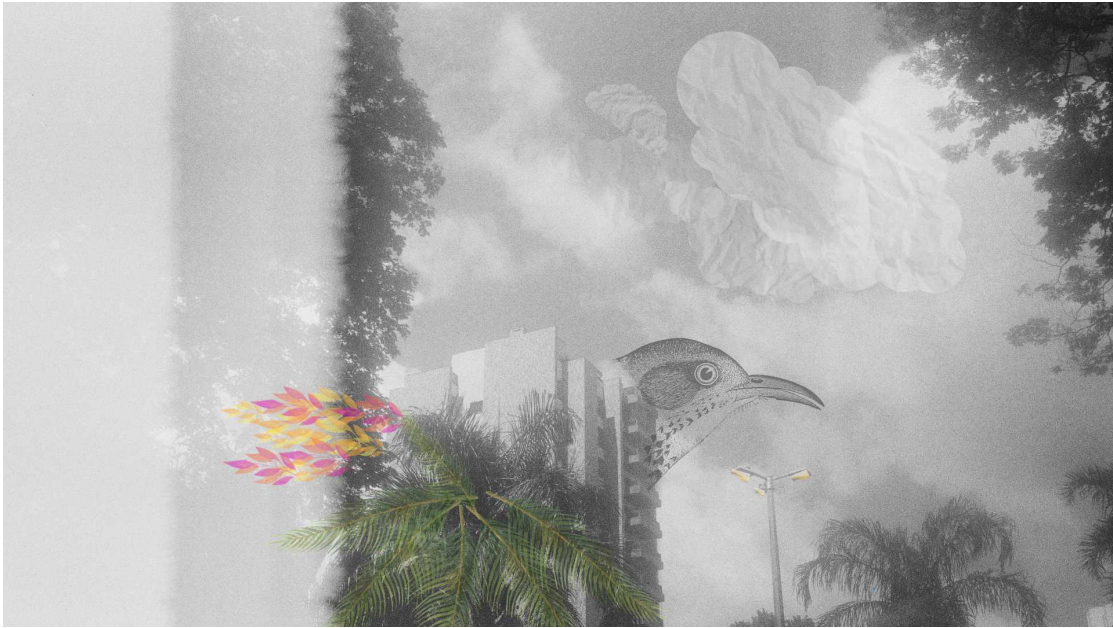
Figura 2. A arquitetura ornitológica de espécies urbanas

analógicas digitalizadas (Fig. 2 e 3), talvez buscando, de alguma forma, a lembrança de que “discutir ecologia sem discutir arquitetura é ilusão”, como Santos (2023, p. 65) pontua.