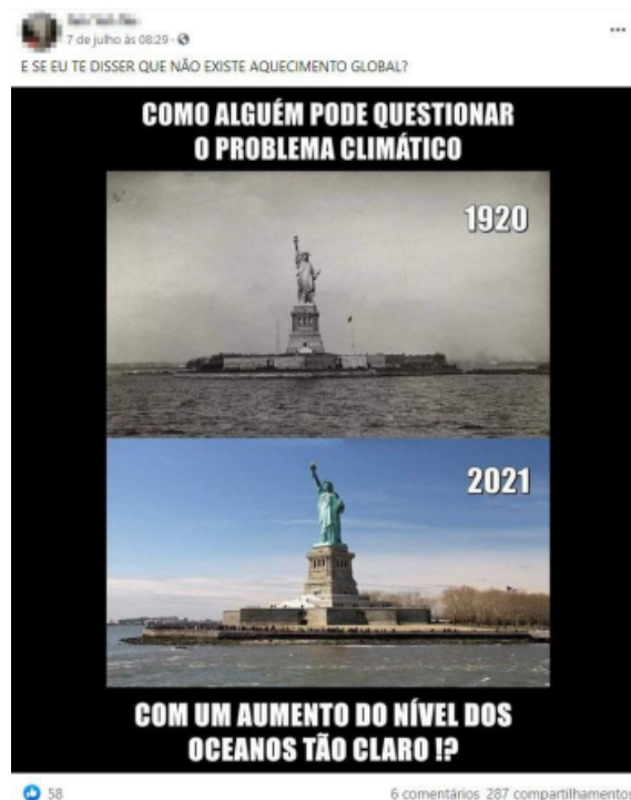
Figura 2: Imagem de referência utilizada na atividade sobre aquecimento global.

A atividade sobre o aquecimento global se enquadra como uma Questão Sociocientífica devido à sua natureza complexa e controversa, que envolve não apenas aspectos científicos, mas também sociais, culturais e políticos. Especificamente, selecionamos essa aula pois, ao incentivar a elaboração de uma resposta para ser compartilhada em um grupo de família em uma rede social, a atividade ampliou possibilidades de a integração entre o conhecimento científico e as práticas cotidianas dos estudantes, incentivando-os considerarem diferentes perspectivas sobre o tema e a se posicionarem diante de uma situação próxima ao seu contexto.