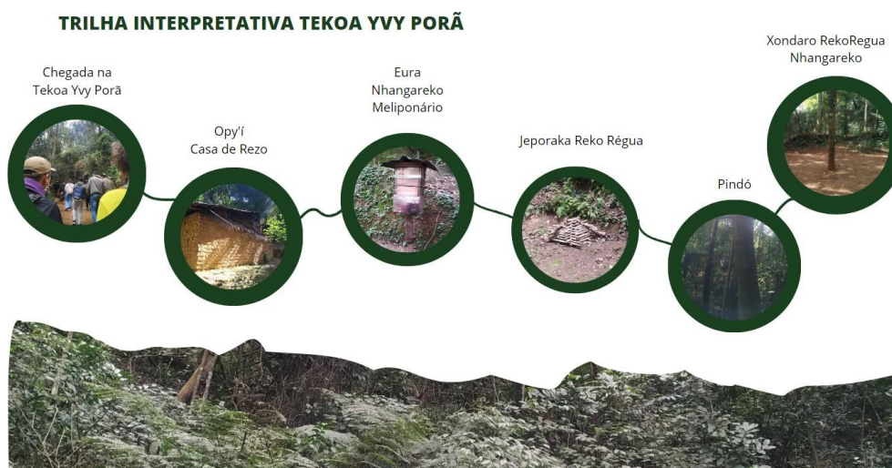
Figura 5: Exemplo de uma participante acerca de uma atividade proposta no portfólio de construção de trilha interpretativa.