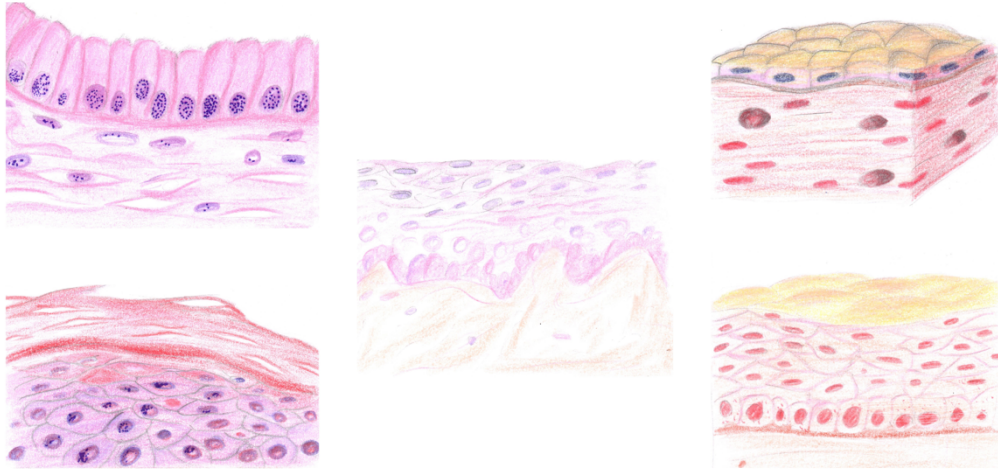
Figura 1: Percorrendo os tecidos humanos