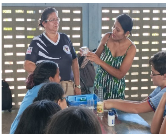
Imagens 1. Aplicação do objeto de conhecimento “Transformações químicas”.