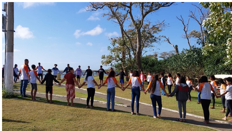
Figura 02. Registro da atividade realizada no porto de Regência.

No campo, os estudantes foram guiados para o entendimento/reavivamento dos aspectos históricos, geográficos e sociais do porto (Fig. 02) e na sequência analisaram características geomorfológicas da praia de Regência. No porto, foram retomadas as temáticas apresentadas na contextualização inicial, por meio de uma abordagem que buscou trazer a ressignificação do meio ambiente, já que se verificou no levantamento prévio que os alunos visualizam a natureza como algo externo e isolado do ser humano. Somos partes integrantes da natureza, seres vivos assim como os demais que habitam toda nossa biodiversidade (Albuquerque, 2007). Porém, as aceleradas mutações técnico-científicas fomentadas no mundo contemporâneo, nos distanciam de relações ambientais multidimensionais (Guattari, 2009). Nesse sentido, foi realizado um diálogo acerca da essência do meio ambiente e do quanto essa visão simplista da natureza favorece ações de exploração indiscriminada, o que potencializa os processos de crise ambiental.