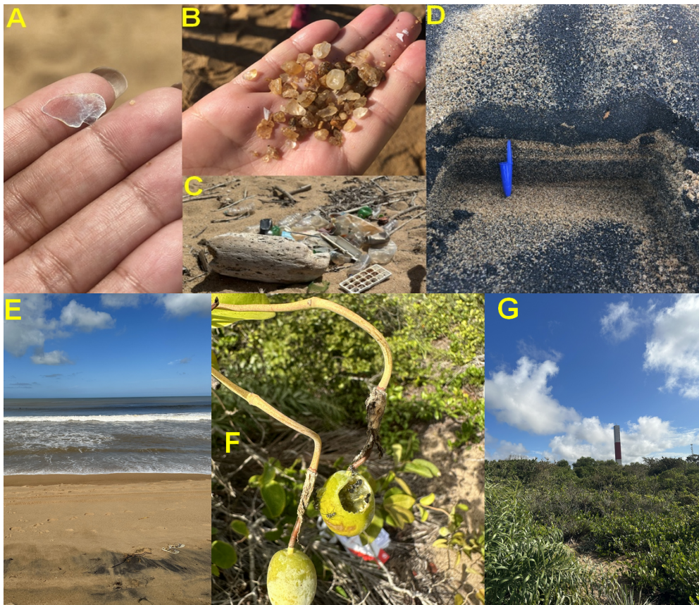
Figura 03. Aspectos geocientíficos identificados na aula de campo na praia de Regência.

Na praia, a coleta de dados foi feita pelos alunos separados em 5 grupos, cada componente recebeu uma grelha de observação, lápis e borracha. Cada grupo ficou responsável por uma temática: água, solo, fauna e flora, relação das tartarugas com Regência e levantamento de impactos ambientais. Observou-se uma assimilação de conhecimentos na perspectiva dos estudantes, visto que foram mencionados aspectos estudados teoricamente em sala de aula, como no caso dos tipos de minerais, classificação do solo, elementos da flora e indicativos de degradação ambiental. A figura 03 aponta a presença da muscovita (A) e outras rochas e minerais (B) presentes na areia. Foi possível identificar a presença de resíduos sólidos (C) trazidos pelas ondas e depositados no sedimento praial, além do excesso de lixo deixado na praia por moradores e turistas.