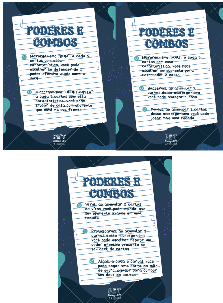
Figura 3: Poderes e combos do jogo.