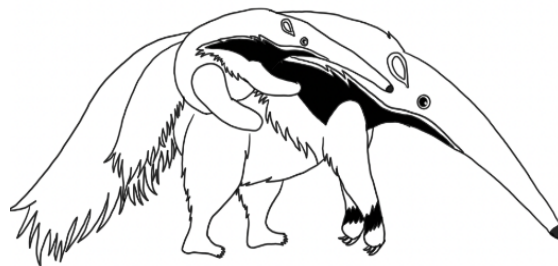
Figura 2: Desenho de um tamanduá com um filhote nas costas