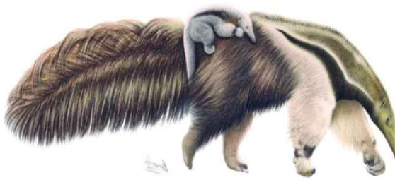
Figura 1: IC de um tamanduá com filhote nas costas