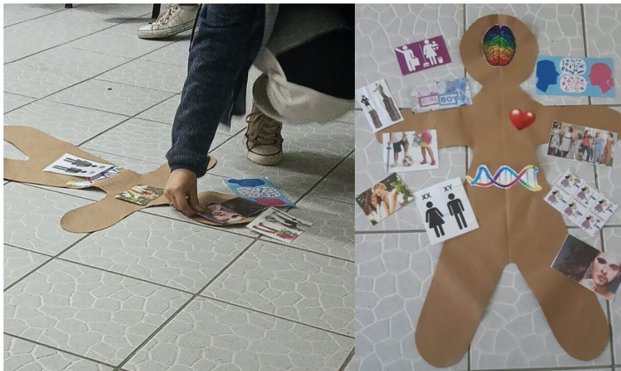
Figura 2: Dinâmica do Biscoito da Sexualidade

Em seguida, foram distribuídas diferentes imagens que remetem à uma ou mais dimensão da sexualidade e o desafio proposto foi colocar a imagem na parte do corpo correspondente a cada categoria (Fig. 2). Com essa dinâmica foi possível observar que os estudantes confundem gênero 6 , orientação sexual 7 e sexo biológico 8 .